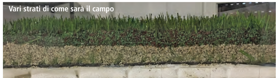
Vari strati di come sarà il campo

Dal 1 maggio 2018 l'avvio dei lavori e la sospensione di tutte le attività sia di pertinenza del Centro sportivo che della scuola.