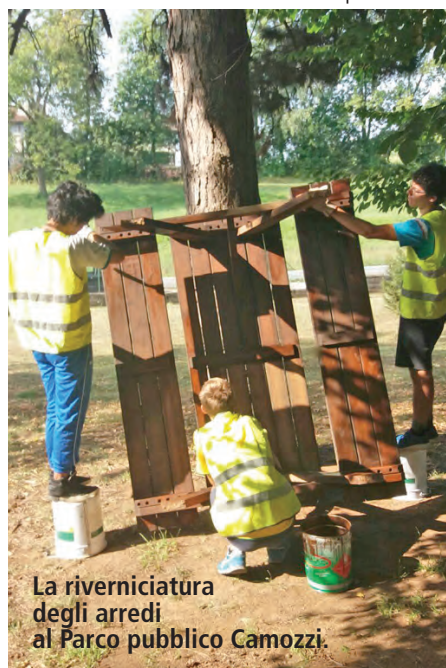
La riverniciatura degli arredi al Parco pubblico Camozzi.