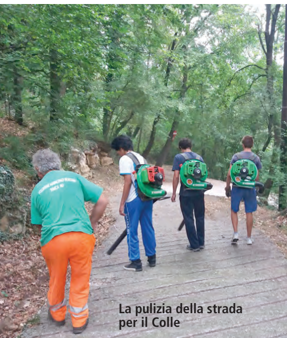
La pulizia della strada per il Colle